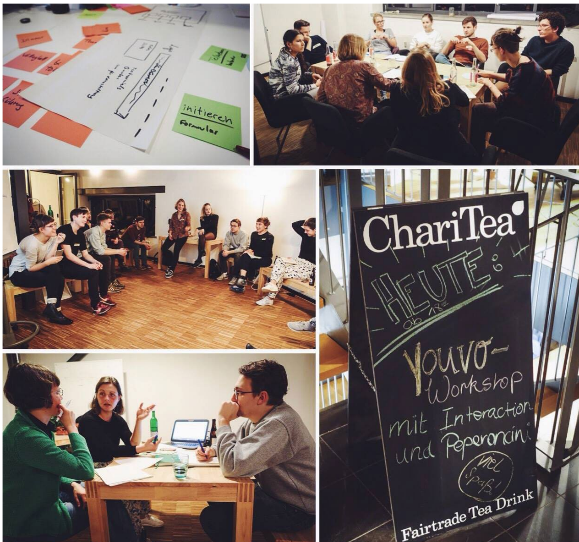
Impressionen des Workshops in Leipzig mit kreativen Freiwilligen und dem Interaction e.V.